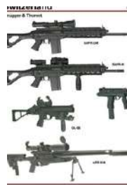
38 MM RESISTENCIA A ARMAS LARGAS