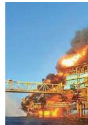
65 MM RESISTENCIA A ZONAS DE TERRORISMO