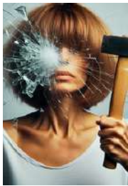
19 MM RESISTENCIA A GOLPES POR INTRUSIÓN