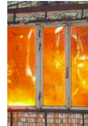
58 MM RESISTENCIA A EXPLOSIONES