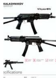
40 MM RESISTENCIA A ARMAS LARGAS HASTA MAGNUM