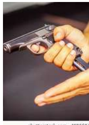
32 MM RESISTENCIA A ARMAS CORTAS