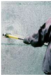
25 MM RESISTENCIA A INTRUSIÓN FORZADA