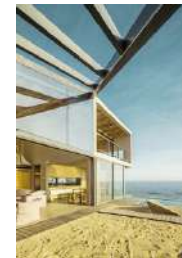
51 MM RESISTENCIA A DESASTRES NATURALES