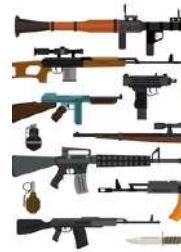
45 MM RESISTENCIA A TODAS LAS ARMAS